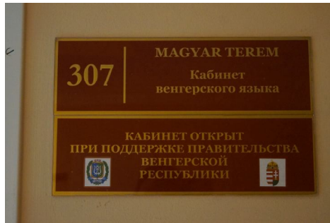
3. kép A Magyar Terem bejáratánál látható magyar–oroszlábla

is feltüntető táblák a hanti-manszijszki a tiszteletbeli cseh konzulátusnak, 2 illetve tiszteletbeli szlovák konzulátusnak 3 is otthont adó épületek bejárata mellett, valamint az Ugor Állami Egyetem épületében található Magyar Terem bejáratánál 4 (ld. 3. kép) láthatók.