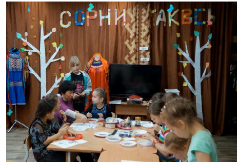
6. kép Manysi nyelvű felirat a Liling Szójum központ termében