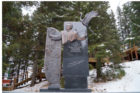
5. kép Juvan Sesztalov emlékműve a Torum-Maa szabadtéri múzeumban

Nem kereskedelmi, hanem oktatási (és részben identitáspolitikai) jelentőségű kivétel még a 2003-ban a város peremén nyílt, majd 2006-ban Hanti-Manszijszk központjába költöző, elsősorban a hanti-manszijszki obi-ugor származású gyerekek kiegészítő oktatását célul tűző alternatív oktatási intézmény, a Liling Szójum 6 Központ bejáratánál látható az intézmény nevét és logóját ábrázoló tábla. Ezen a feliraton kívül az intézmény legnagyobb, rendezvények során is használt helyiségében rendszeresen olvashatók az évszakhoz, programhoz kapcsolódó obi-ugor nyelven írt feliratok (ld. 6. kép). Bár a központ hangsúlyosan vállalni kívánja a hanti és manysi nyelv, csoport reprezentációját egyaránt, úgy a központ bejáratánál, mint a belső tereken elhelyezett táblák inkább a manysi anyanyelvűekhez, manysiul tanulókhöz szólnak.